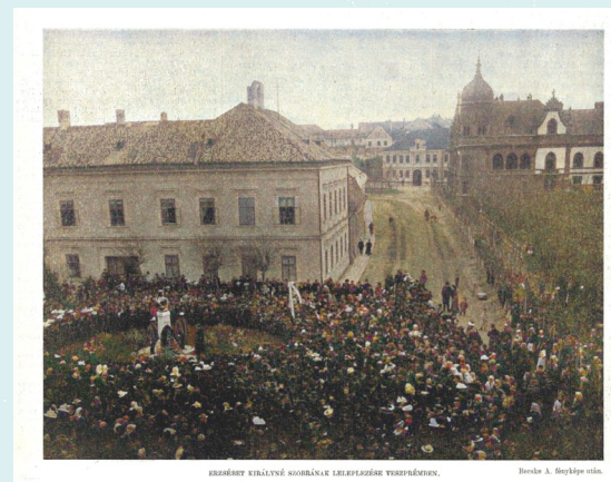
A veszprémi Erzsébet-szobor

„Boldog emlékű Erzsébet királyné emlékezetét az ország minden részén folyton több és több szobor, intézet, alapítvány hirdeti. Veszprém városa is szép mellszoborral áldozott kegyeletének. A szobor Zala György jeles szobrászunk műve és november 19-én, Erzsébet-napján avatták